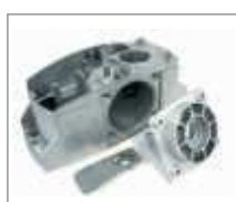
4,5 kg aluminium