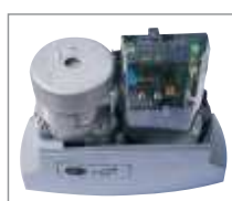
Centrala sterująca zasilana napięciem 230V