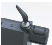
Łatwe i szybkie wysprzężenie