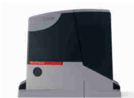
CIŚNIENIOWY ODLEW OBUDOWY I DŹWIGNI WYSPRĘŻLENIA, POLAKIEROWANY EPOKSYDOWO

Zaawansowany: siła, tryb pracy, prędkość, mogą być regulowane na kilku poziomach. Za pomocą programatora 0-View istnieje możliwość bardzo dokładnego ustawienia parametrów funkcji.