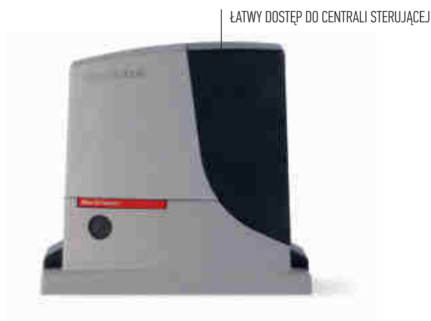
ŁATWY DOSTĘP DO CENTRALI STERUJĄCEJ