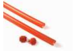
XBA13 listwy ochronne, gumowe, czerwone na ramię XBA, 9x1 m 120,00 147,60 brutto