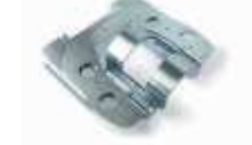
XBA10 uchwyt przegubowy dla ramion 3 lub 4 m 370,00 455,10 brutto