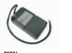
PS224 akumulator 24V 7.2 Ah z wbudowaną kartą ładowania 460,00 565,80 brutto