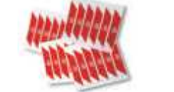
WA10 nalepki ostrzegawcze na ramię szlabanu (24 szt.) 80,00 98,40 brutto