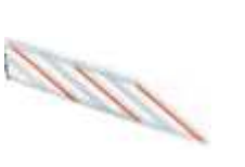
WA13 listwy aluminiowe, zabezpieczające, pod ramię płaskie, w odc. 2 m (do szlabanów M5BAR, M7BAR, LBAR) 320,00 393,60 brutto