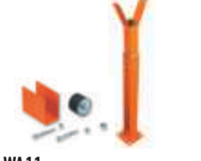
WA11 podpora ramienia stała, regulowana wysokość 250,00 307,50 brutto