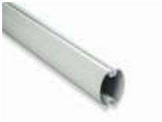
XBA15 ramię aluminiowe, owalne, 69x92x3150 mm 200,00 246,00 brutto