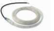
XBA6 diodowe światła ostrzegawcze, 6 m 200,00 246,00 brutto