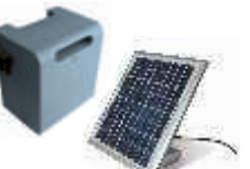
SOLEMYO (SYKCE) zestaw zasilania słonecznego 1 350,00 1 660,50 brutto