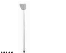
WA12 podpora ramienia ruchoma (do szlabanów M5BAR, M7BAR, LBAR) 250,00 307,50 brutto