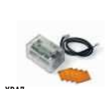
XBA7 moduł lampy sygnalizacyjnej do szlabanów BAR 175,00 215,25 brutto