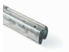
XBA9 łącznik do ramion XBA15/XBA14/XBA5 80,00 98,40 brutto