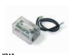
XBA8 moduł semaforów do szlabanów BAR 250,00 307,50 brutto