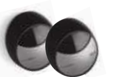
MOFB fotokomórki (para) BLUEBUS zasieg 15-30 m 190,00 233,70 brutto