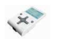
OVIEW/A programator, połączenie za pomocą BUS T4 650,00 799,50 brutto